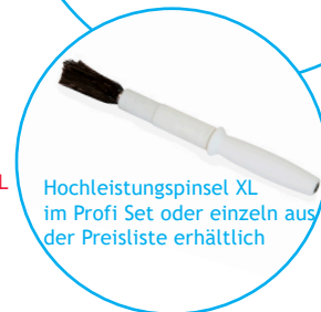
Hochleistungspinsel XL im Profi Set oder einzeln aus der Preisliste erhältlich

Wir bieten zum Brush-IT unseren Hochleistungspinsel XL mit 1.4 Mio. Fasern an.