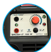
BRUSH IT mit Beschriftungsfunktion