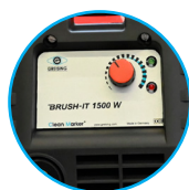
BRUSH IT ohne Beschriftungsfunktion